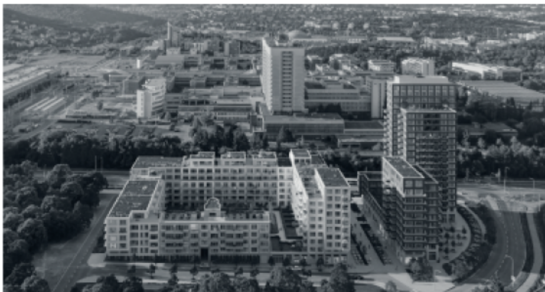
Vizualizace multifunkčního projektu Brixx od Pečák a partner architekti v Brně-Bohunicích, kde vzniknou i nájemní byty pro studenty. vizualizace Pečák a partner architekti

V regionech také stoupá zájem nemovitostních fondů o odkup nájemních bytů. Zatímco donedávna developři cílili spíše na menší investory, kteří si pořizovali k pronájmu jednotky bytů, nyní chystají k prodeji celé projekty nebo jejich části. Například český fond Mint koupil od společnosti Trigma Real Estate sto bytů v Plzni-Skvrňanech. Pronajímat je začne letos. „Byty budou plně